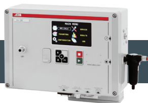
Carcasa impermeable F610