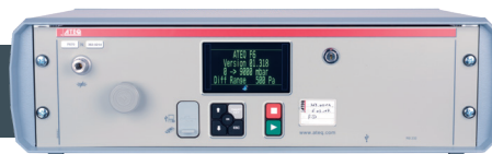
Carcasa 3U de 19" F670