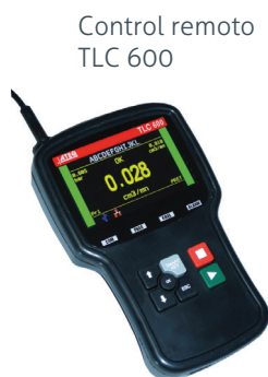
Control remoto TLC 600